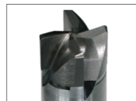
刃先形状 Cutting edge shape